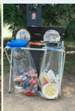
Les supports de tri