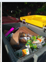
Les containers bien triés